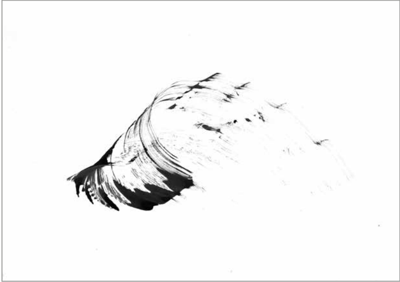
Tom Peters, onde, Chinatusche auf Karton (Walddaubenfeder), 2017