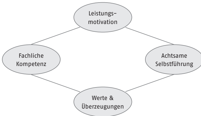
Abb. 1 | Einflussfaktoren der Employability